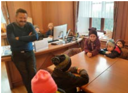
Zu Besuch im Gemeindeamt