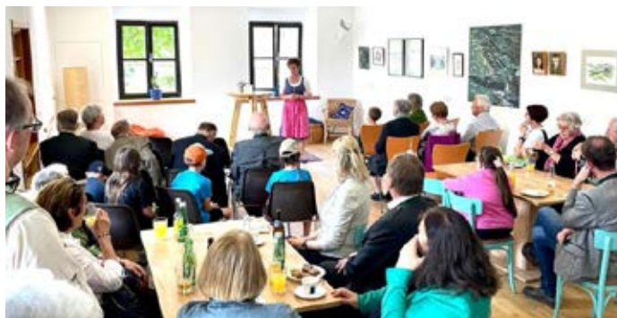
Danach: Im Sommer 2023 kommt der neue gestaltete Raum beim Publikum gut an