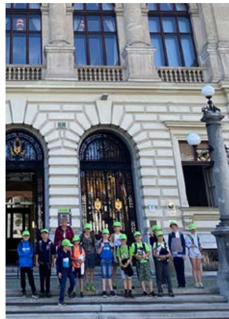
Unsere Schulkinder vor dem Rathaus in Graz

Mit einem Rucksack voll neuer Eindrücke, Erkenntnisse, Erlebnisse und Erfahrungen ging es klimafreundlich mit dem öffentlichen Bus wieder zurück nach Hause.