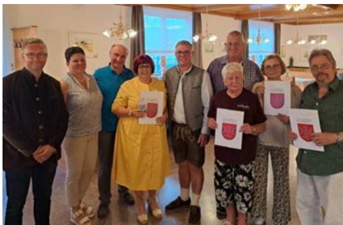
Gästeehrungen im LH Schwaiger

Jahre Gästetreue im Landhotel Spreitzhofer geehrt und im Juli vier Familien im Landhotel Schwaiger für ihre langjährige Treue geehrt.