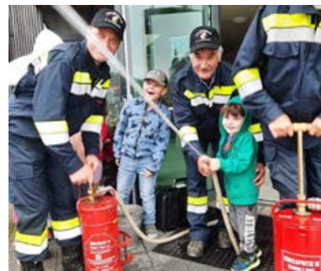
„Wasser marsch“ mit der Feuerwehr

Für alle Kinder waren es ein sehr erlebnisreiches Jahr.