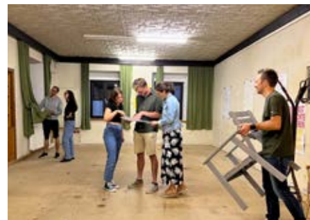
Davor: Im Sommer 2022 - erste Planungen